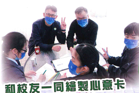
和校友一同繪製心意卡

為表達對長者的關懷和敬愛，以「荔天傳情45載，攜青敬老榮主愛」為主題，舉辦「探訪長者日」。活動由香港都會扶輪社，以及學校家教會贊助，並由長者安居協會葵青區關愛長者大使計劃、南葵涌社會服務處協辦。全體教職員及近300名學生參與了是次活動，將天主教教育核心價值之「愛德」及「家庭」傳揚到社區，並按照耶穌基督的教導，身體力行服務弱勢社群。