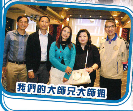
我們的大師兄大師姐