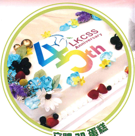
立體 3D 蛋糕