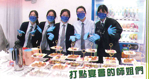
打點宴會的師姐們