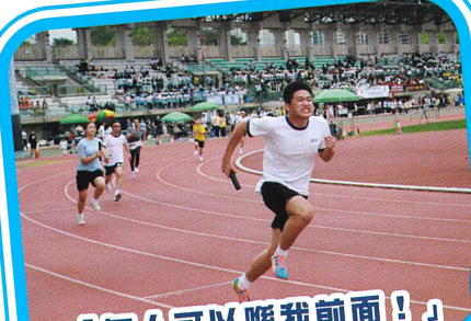
「無人可以睇我前面！」