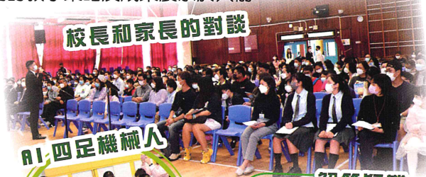
校長和家長的對話

每年學校都會舉辦開放日，以展示各科組的教學成果，不知道大家在小學五六年級時有到校參觀嗎？當天禮堂舉行了「小學升中資訊日」，為各區家長及小學生提供了專業的升中選校最新資訊；至於校舍各個角落則交由各科組開設「學習角」、「交流區」、「試用處」等，讓各科組不同的教學策略及成果展示於人前。