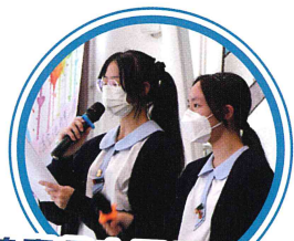
拍賣會由兩位中四師姐主持

學校的「宗教事務委員會」及「啟發潛能教育委員會」，在午息時段於新翼有蓋操場舉辦了「荔天 45 周年校慶明愛拍賣會」，活動由學生啟發潛能教育小組幹事主持，當日的拍賣品由香港都會扶輪社、校友、教職員及同學送出，師生們競投熱烈，大家都在歡樂的氣氛中，為明愛籌得善款。